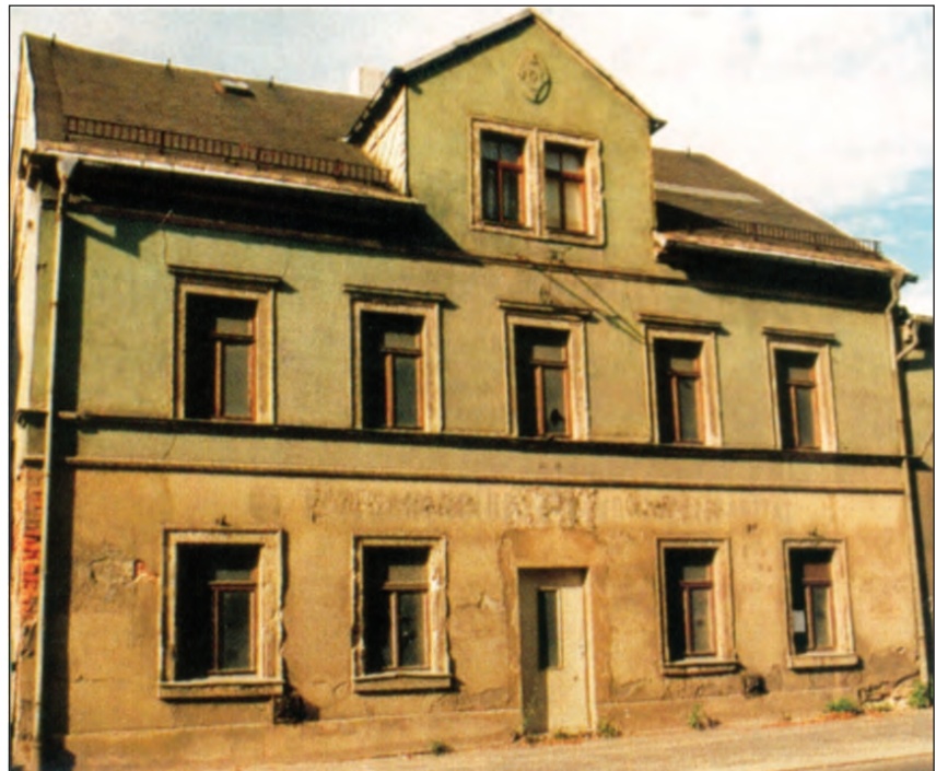
Der erste Klub in Karl-Marx-Stadt an der Limbacher Straße (Foto aus den 90er Jahren)

Auf der III. Zentralen Delegiertenkonferenz in Berlin wurde ein umfangreiches Programm zur Betreuung älterer Bürger beschlossen. Um an alte Traditionen anzuknüpfen, entstand 1956 der erste