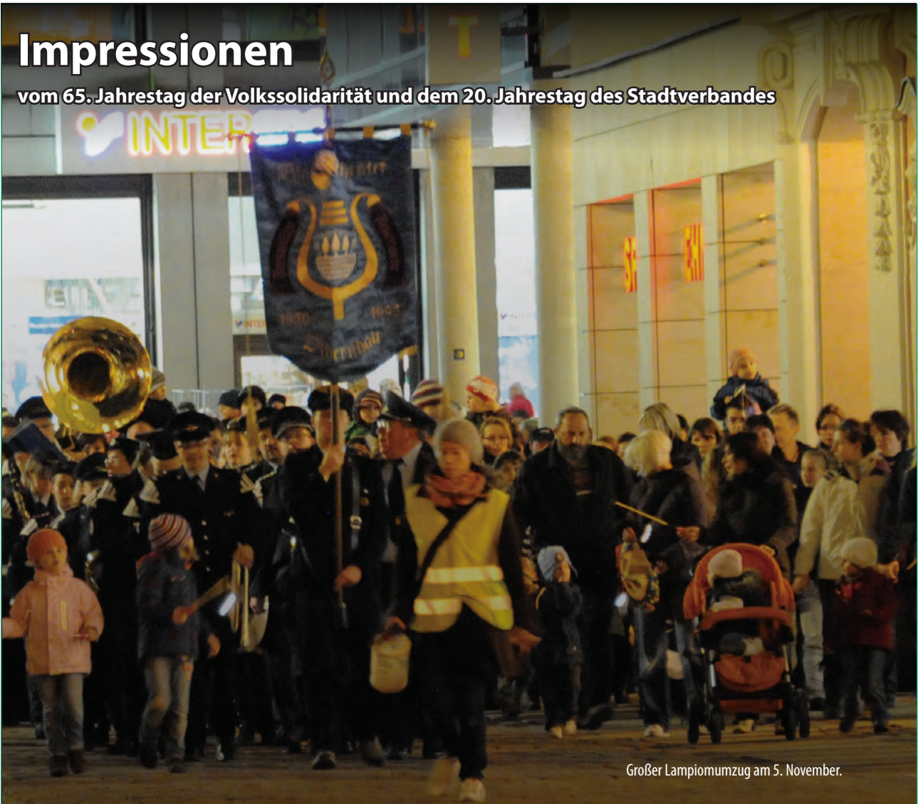
Großer Lampiomumzug am 5. November.

vom 65. Jahrestag der Volkssolidarität und dem 20. Jahrestag des Stadtverbandes