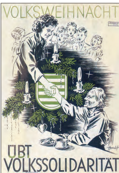
Plakat zur ersten Friedensweihnacht

So vielfältig die Mittel zur Unterstützung notleidender Bevölkerungsteile waren, so zahlreich waren auch die Hilfsmaßnahmen den Betroffenen gegenüber. Zu den notleidendsten Gruppen der Nachkriegszeit gehörten Flüchtlinge. Um diesen zu helfen, wurden in Chemnitz amtliche Hilfsmaßnahmen zur Flüchtlingsbetreuung organisiert. Im Mai 1946 wurde eine Abteilung „Flüchtlingsvorsorge“ gebildet, die sich vorrangig um die Unterbringung der Menschen kümmerte. In öffentlichen Gebäuden wie Schulen, Fabriken und Kirchen wurden vorüberge-