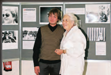
Eröffnung der Ausstellung „ANNÄHERUNGEN“ in der Filiale Chemnitz der AOK Plus am 3. September.