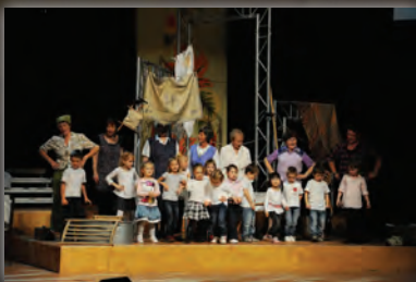
Mitglieder des Frauenchors mit Kindern aus zwei Kindertagesstätten beim „Bunten Herbstlaub – Ein Kessel Buntes zum 65.“ am 22. September.