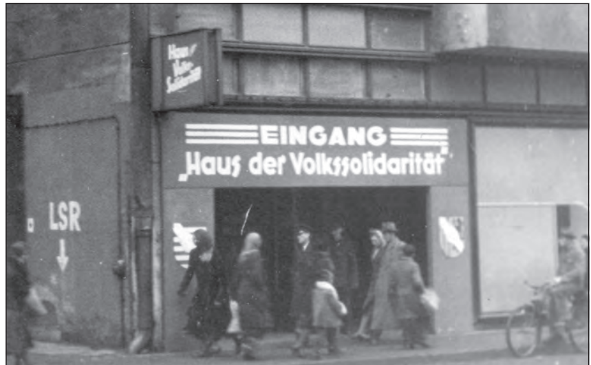
Das „Haus der Volkssolidarität“ im ehemaligen Kaufhaus Schocken/Merkur

Wie in vielen anderen Städten Deutschlands war auch in Chemnitz die Not nach dem Krieg groß. Durch Luftangriffe der Alliierten im März und April 1945 wurden nicht nur zahlreiche Fabriken und öffentliche Gebäude, sondern auch etwa ein Viertel aller Wohnungen zerstört.