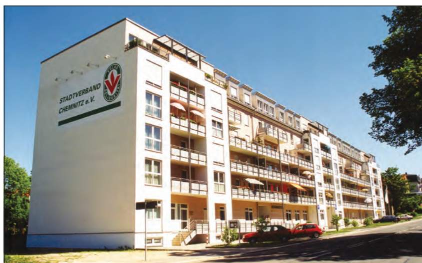
1997 wurde mit dem Gebäude Clausstraße 25-33 die erste Wohnanlage für Betreutes Wohnen des Stadtverbandes eröffnet.

Mit Übernahme der Trägerschaft über vier Kindertagesstätten knüpfte die Volkssolidarität Chemnitz an die alte Tradition Kinderbetreuung aus der Anfangszeit des Verbandes an. Alternati-