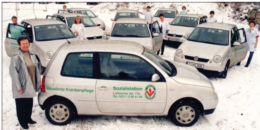
Der Fuhrpark der Sozialstation wuchs mit der Anzahl der Mitarbeiter stetig: Renate Hübner und ihre Kollegen mit neuen Fahrzeugen im Jahr 2001.

Dem Vorbild der Alten- und Kinderspeisung der Nachkriegszeit und der Folgejahre folgend, gehört der Mahlzeitendienst weiterhin zu den stark nachgefragten Angeboten der Volkssolidarität. Spezielle, auf Senioren abgestimmte Menüs, werden nach Hause geliefert, können aber auch in Gemeinschaft mit anderen Menschen in den Begegnungsstätten und Stadtteiltreffs gegessen werden. Bereits 1990 wurde mit dem „Essen auf Rädern“ begonnen. Gemeinsam mit der Firma apetito konnte der Stadtverband ab 1992 den Essenteilnehmern über 100 Tiefkühlmenüs anbieten, welche einmal wöchentlich nach Hause geliefert wurden. Ein elektrisches Aufwärmgerät sowie eine Kühlbox konnten vom Mahlzeitendienst gegen eine geringe Gebühr ausgeliehen werden. Die Essensteilnehmer hatten so die Möglichkeit, sich täglich ein schmackhaftes Essen in nur wenigen Minuten selbst zuzubereiten. 1994 konnte die erste Küche des Stadtverbandes eingeweiht werden und 1999 erfolgte die Inbetriebnahme der neu erbauten Zentralküche in der Zwickauer Straße. Im Jahr 2000 erweiterte die Ein-