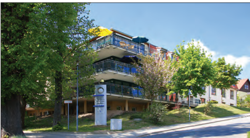
Die 2001 eröffnete Seniorenresidenz „Villa von Einsidel“ in Flöha ist das erste von der EURO Plus Senioren-Betreuung GmbH betriebene Pflegeheim.

Im Mai 1994 übernahm der Stadtverband das Alten- und Pflegeheim an der Mozartstraße in die Trägerschaft und bietet seitdem auch stationäre Pflege an. Zwei 1956 gebaute Häuser wurden schon seit den 60er Jahren als kommunales Altenheim genutzt. Auf dem 10.000 Quadratmeter großen Gelände begann im September 1998 der Neubau eines modernen, zeitgemäßen Pflegeheims. 1999 erfolgte der Umzug in den Neubau. Im Mai 2000 wurde die EURO-Plus-Senioren-Betreuung GmbH gegründet. Gemeinsam mit regional ansässigen Stadt-, Kreis- und Regionalverbänden der Volkssolidarität plant und betreibt das Tochterunternehmen des Stadtverbandes Seniorenpflegeheime. Im August 2001 nahm die Seniorenresidenz „Villa von Einsidel“ in Flöha ihren Betrieb auf. 2003 folgte die Eröffnung des Seniorenpflegeheims „An der Burgstädter Straße“ in Mittweida als Ergänzung zur bereits bestehende Wohnanlage für Betreutes Wohnen des Chemnitzer Stadtverbandes mit Sozialstation und Begegnungsstätte zu einem Sozialstützpunkt. 2004 erfolgte die Übernahme eines Heims in Hohenstein-Ernstthal. Es ist durch einen Neubau erweitert worden, der 2005 unter dem Namen Parkresidenz in Betrieb genommen wurde. In den kommenden Jahren kamen noch die Seniorenresidenz „An der Rädelsstraße“ in Plauen (2007), die Seniorenresidenz „Rosengarten“ in Radebeul (2008) und das Seniorenzentrum Bergkristall in Freiberg (2009) hinzu.