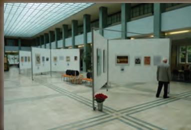
Eröffnung der Ausstellung „30 Plakate aus 65 Jahren“ in der Filiale Chemnitz der AOK Plus am 3. September.