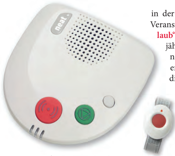
Hausnotrufgerät mit Handsender

Um den Menschen in den eigenen vier Wänden noch mehr Sicherheit bieten zu können, nahm im Mai 1997 in Form des Tochterunternehmens VHN GmbH der Hausnotruf der Volkssolidarität seine Arbeit auf. Mit einem Handsender, nicht größer als eine Armbanduhr, können per Knopfdruck Notrufe aus der ganzen Wohnung an eine 24h besetzte Notrufanlage gesendet werden. Die erforderlichen Hilfsmaßnahmen können sofort veranlasst werden. Das Angebot wurde in den letzten Jahren beispielsweise durch Rauchmelder, die mit der Notrufzentrale verbunden sind, oder Seniorenhandys erweitert.