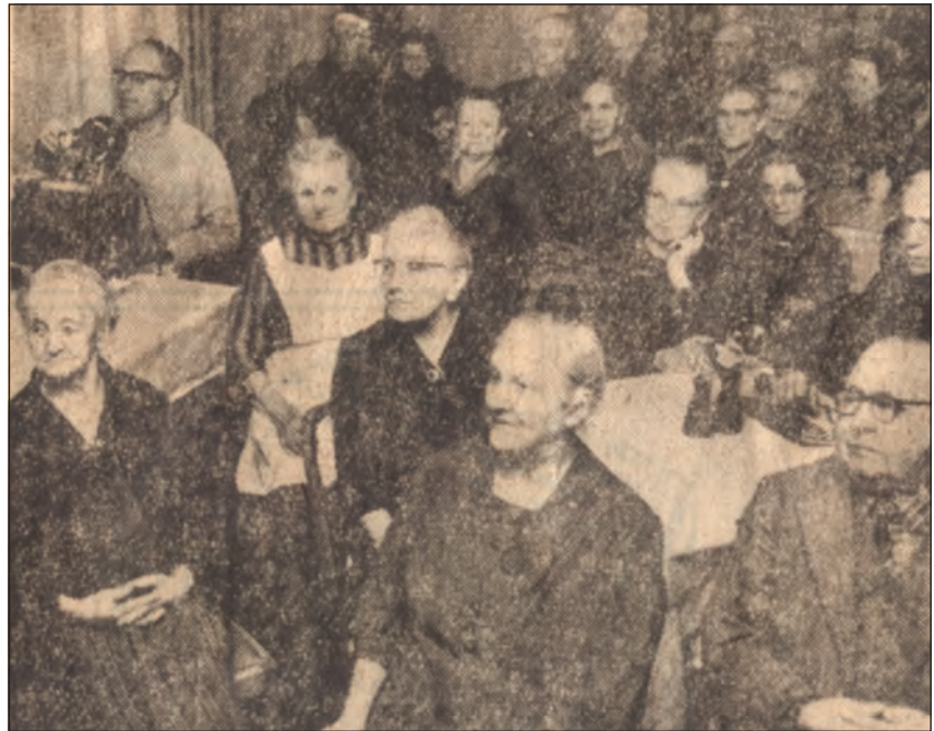
rechts: URANIA-Vortrag im Veteranenklub Bergstraße in Chemnitz

Trupp“, der sich zusammen mit anderen Jugendlichen der Hilfe für hilfsbedürftige Menschen verpflichtet) haben Kinder und Jugendliche insbesondere in der kalten Jahreszeit älteren Bürgern beim Beheizen der Wohnungen Unterstützung geleistet, gingen für die hochbetagten Bürger einkaufen und erledigten weitere Besorgungen.