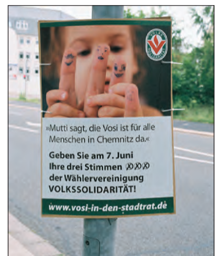
Wahlkampfplakat der Wählervereinigung

lervereinigung Volkssolidarität Chemnitz (VOSI) mit dem Ziel, den Wählern bei der Wahl zum Chemnitzer Stadtrat am 7. Juni 2009 eine Alternative mit sozialer Kompetenz bieten zu können. Die Wählervereinigung erhielt 4,23 % der Stimmen und damit zwei Sitze im kommunalen Parlament.