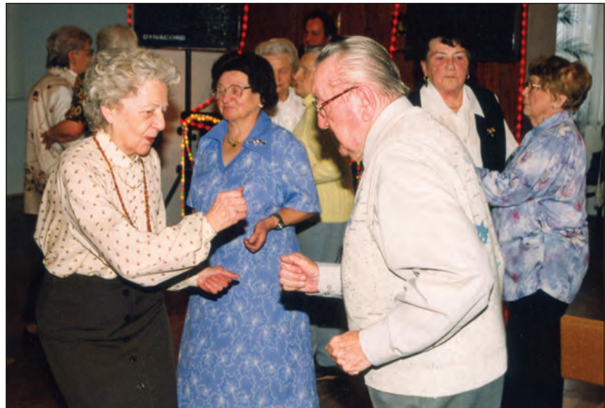
Tanzveranstaltung in einer Begegnungsstätte

Die Hauswirtschaftspflege ist eines der wenigen Tätigkeitsfelder, welches auch nach der Umstrukturierung der 50er Jahre und der Wendezeit bis heute besteht. Seit 1991 werden diese Leistungen zu-