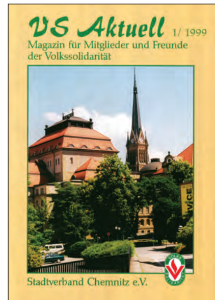
Titelblatt der ersten Ausgabe der VS Aktuell

In den Jahren 2000 bis 2004 erfolgte eine Neustrukturierung der Wohngruppen . Diese können ihre Handlungsfähigkeit erhöhen, wenn sie starke Leitungen haben und durch größere Mitgliederzahlen auch über höhere finanzielle Mittel verfügen. Mehrere Wohngruppen schlossen sich daraufhin zusammen. In den Leitungen wurden seitdem neben dem Wohngruppenleiter, seinem Stellvertreter, Hauptkassierer und Revisor auch Verantwortliche für Kultur und soziale Betreuung gewählt. Entsprechend ihrer Verantwortungsbereiche wurden die Lei-