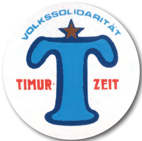
oben: Anstecker der Timurbewegung