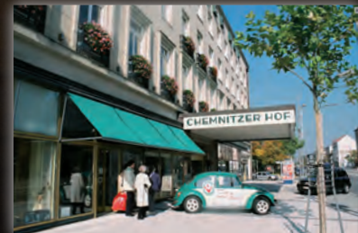
Der VW Käfer des Stadtverbandes vor dem Hotel Chemnitzer Hof während der Dankeschön-Veranstaltungen vom 12. bis 14. Oktober.